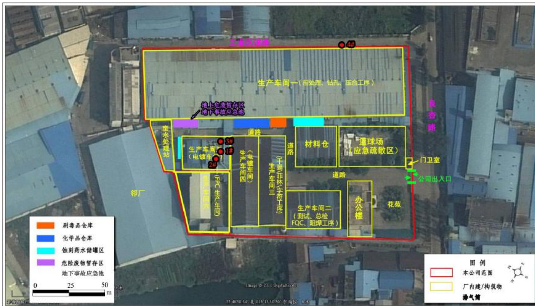
附图 1：项目厂区平面图